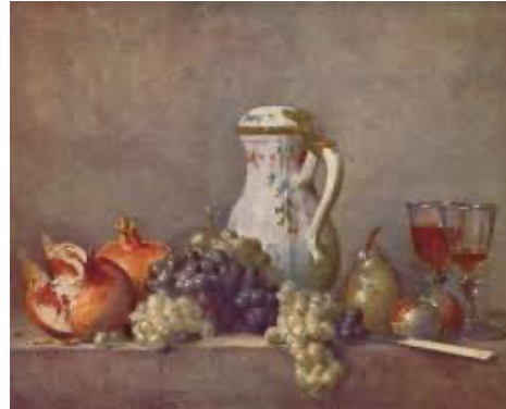
Raisins et grenades Jean Siméon CHARDIN - 1763 Musée du Louvre