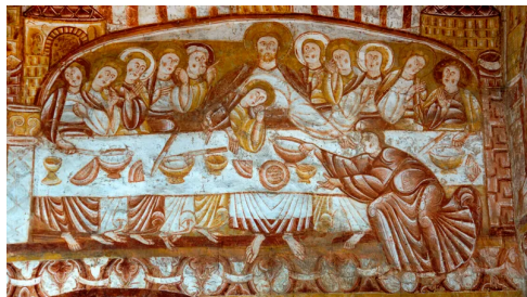
La Cène Fresque de l'église St Martin de Vic - 12 e siècle